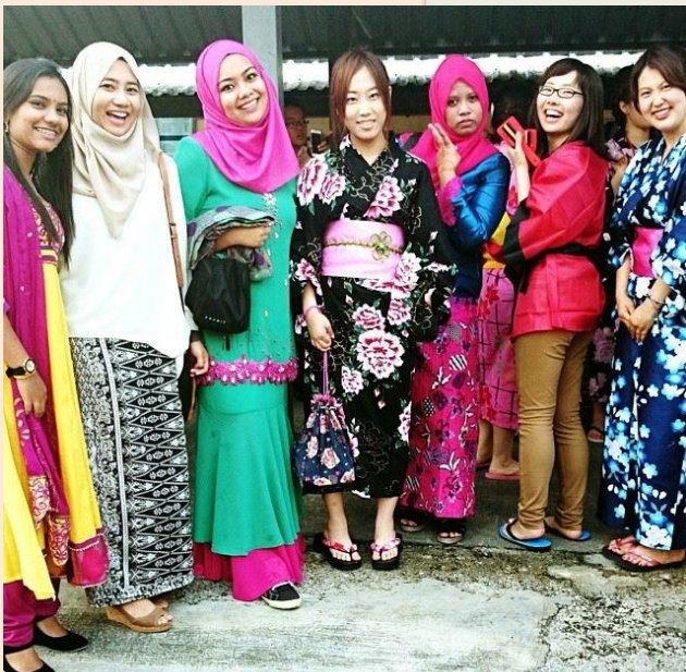
各々の伝統衣装を着て(下)

私はこの時、 大学2年 でしたが、低学年で知識が乏しいにも関わらず、英語での講義を聴いたり、海外の友達と交流することができました。確かに知識があり、英語がしゃべれたら不自由することはないです。しかし専門知識がなくても、英語に自信がなくても、海外でアクションを起こしたい！海外の友達と話したい！という 強い気持ち と、ちょっとした 勇気 があれば、低学年でも海外に行くことができます！！